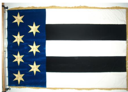
Obrázek 4: Obecní prapor

List tvoří modrý žerďový pruh do jedné třetiny délky, na kterém je sedm žlutých šesticípých hvězd ve dvou svislých řadách a pět vodorovných pruhů, střídavě bílých a černých. Žerďový modrý pruh se žlutými hvězdami se shoduje s modrou hlavou štítu. Střídavě bílé a černé vodorovné pruhy mají oporu se shodně zbarvených figurách znaku.