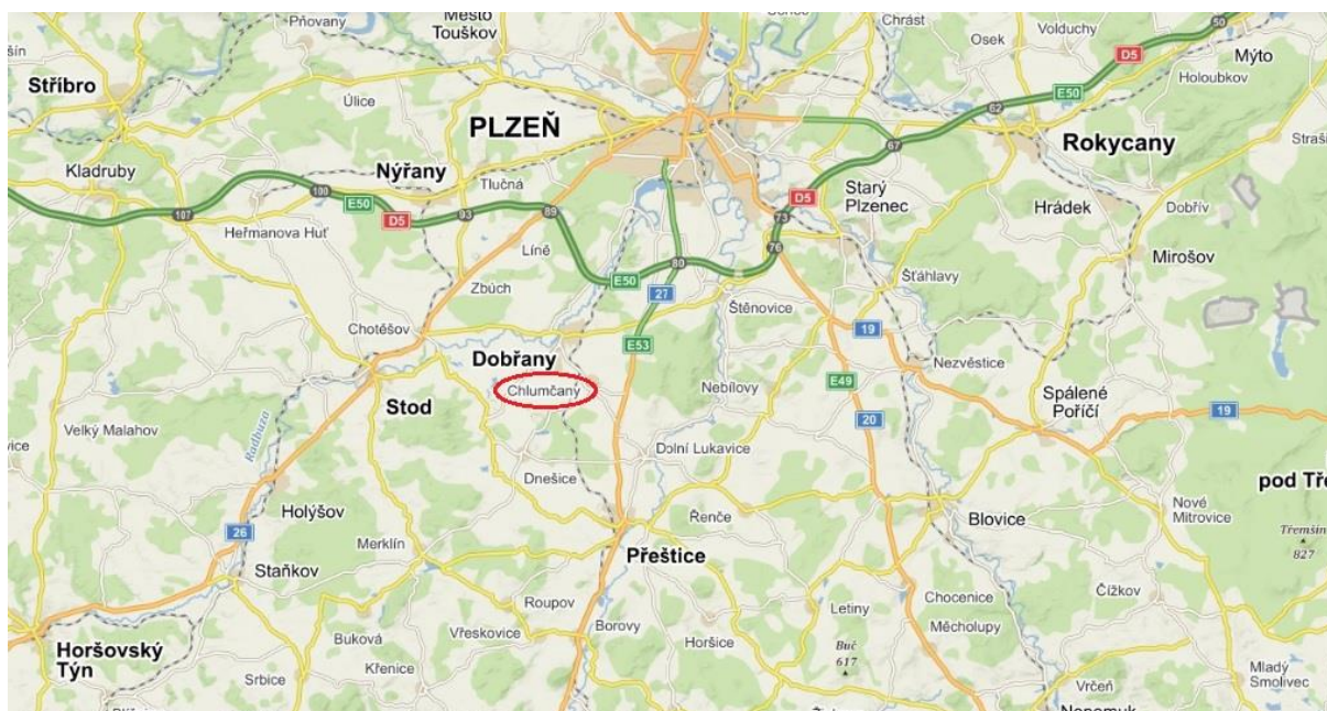
Obrázek 1: Mapa obce Chlumčany

Obec je členem Mikroregionu Radbuza, Mikroregionu Přeštice, MAS Aktivios, Sdružení měst a obcí Plzeňského kraje a Svazu měst a obcí České republiky.