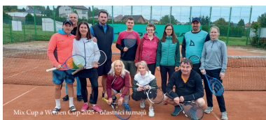
Mix Cup a Women Cup 2025 - účastníci turnajů

Dne 27. 9. 2025 se odehrála poslední akce sezóny v Chlumčanech – souběžně byl odehrán turnaj žen a turnaj smíšených dvojic. Akce se zúčastnilo celkem 12 tenistů, z toho 6 žen.