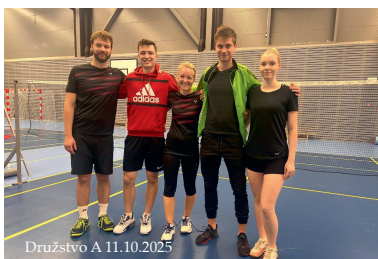
Družstvo A 11.10.2025