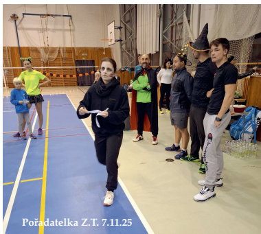
Pořadatelka Z.T. 7.11.25