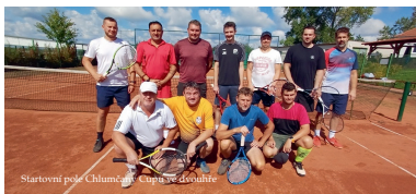
Startovní pole Chlumčany Cupu ve dvouhře