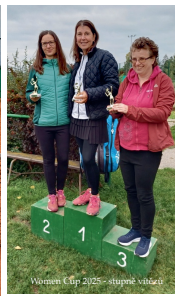
Women Cup 2025 - stupně vítězů