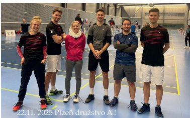
22.11. 2025 Plzeň družstvo A!