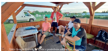
Vítěz čtenosti B-týmu v výhře v posledním utkání Davis Cupu