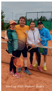
Mix Cup 2025 - finalové dvojice