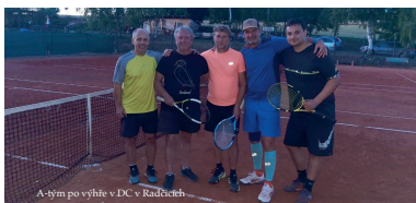
A-tým po výhře v DC v Radčicích

Chlumčany B – Spartak Sedlec D 1:2 1. ČLTK B – Chlumčany B 3:0 Chlumčany B – Angry Baseliners 0:3 TK Sokol Přeštice B – Chlumčany B 3:0 All in Slavia – Chlumčany B 3:0 Chlumčany B – Radobyčice B 0:3 Tatranky – Chlumčany B 2:1 Chlumčany B – Rapid Plzeň C 2:1