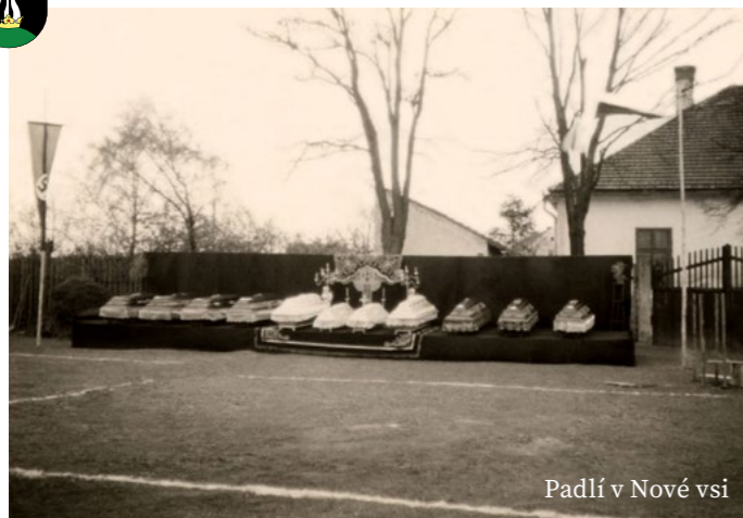
Padlí v Nové vsi

Letos 17. dubna uplyne 80 let od tohoto tragického náletu. Tragického pro město Dobřany a obec Nová Ves (zahynulo 11 lidí), ale i pro výše zmíněnou osádku. I když bomby přinesly zkázu městu, kde z vojenského hlediska nebylo vůbec nic důležitého, musíme si uvědomit, že se jednalo o omyl. Jednalo se o boj proti nacistickému Německu a kdyby se nálet vydařil, ochromilo by to vážným způsobem Německou zbrojní mašinerii. I Britské královské letectvo za tento nálet zaplatilo vysokou cenu, během tohoto zcela neúspěšného náletu ztratilo 39 letadel z celkového počtu 327 strojů. Bohužel ve válce jsou ztráty na všech stranách.