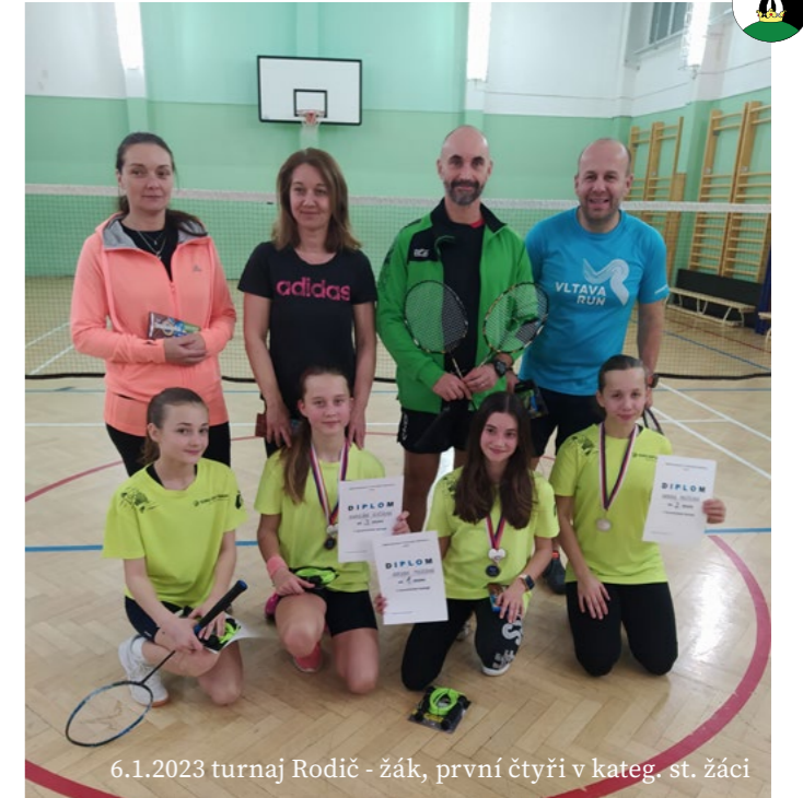
6.1.2023 turnaj Rodič - žák, první čtyři v kateg. st. žáci

Rok 2023 začal pro náš oddíl velice rychle. Hned v pátek 6.1. jsme pro naši mládež uspořádali v tělocvičně naší ZŠ, Novoroční turnaj rodič (trenér) + žák a to s účastí devíti dvojic!