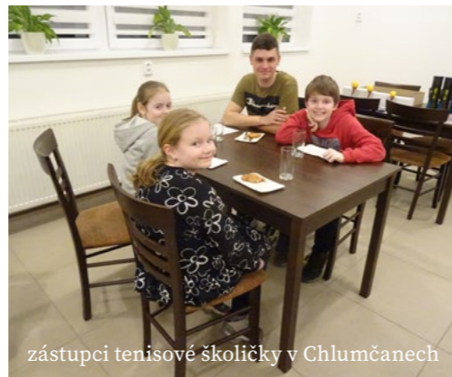
zástupci tenisové školičky v Chlumčanech