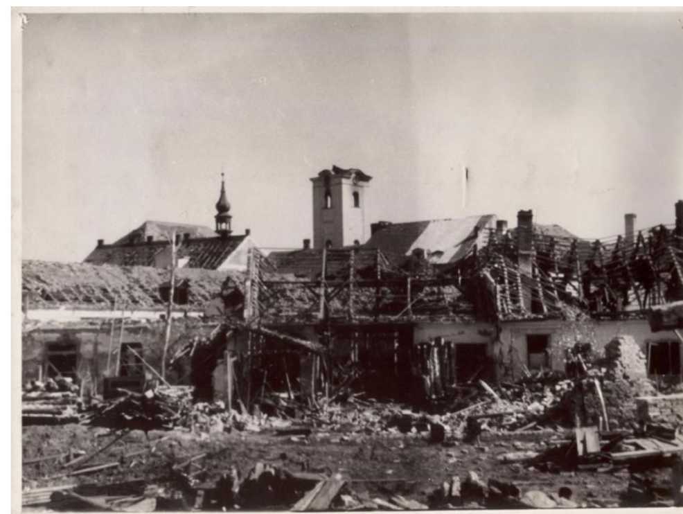
Dobřanská zvonice po zásahu zápalnou pumou vyhořela.

Po náletu bylo pořízeno značné množství fotografií zničených a poškozených domů, neexistuje však jediný snímek zachycující sestřelený letoun. Náletu využila i německá propaganda a natočila dokument „Teroristické přeapadení sudetoněmeckého města Wiesengrund“.