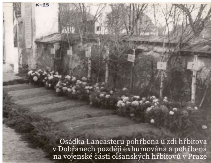
Osádka Lancasteru pohřbena u zdi hřbitova v Dobřanech později exhumována a pohřbena na vojenské části olšanských hřbitovů v Praze

Za KVH Posádkového velitelství v Dobřanech M. Faiřr - 604 988 403