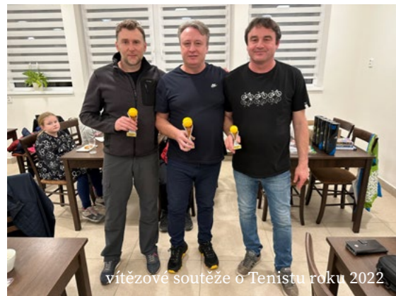
vítězné soutěže o Tenistu roku 2022