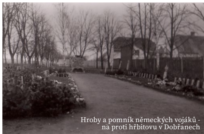
Hroby a pomník německých vojáků - na proti hřbitovu v Dobřanech