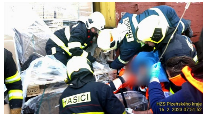
HZS Píseňského kraje 16. 2. 2023 07:51:52