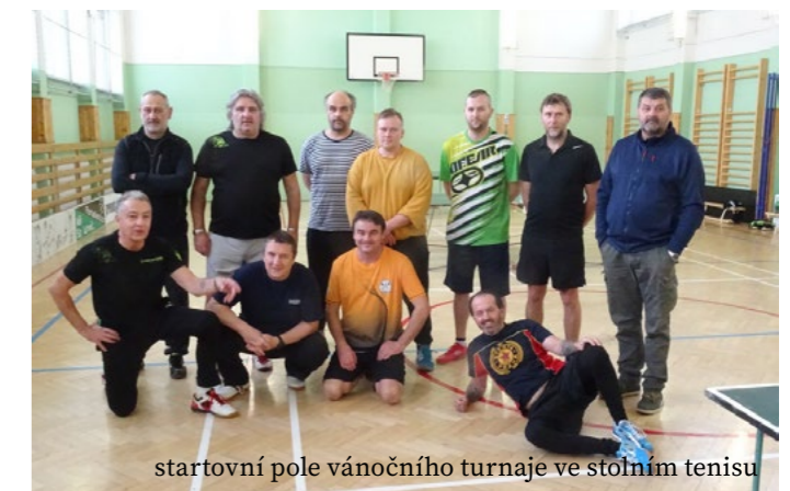
startovní pole vánočního turnaje ve stolním tenisu