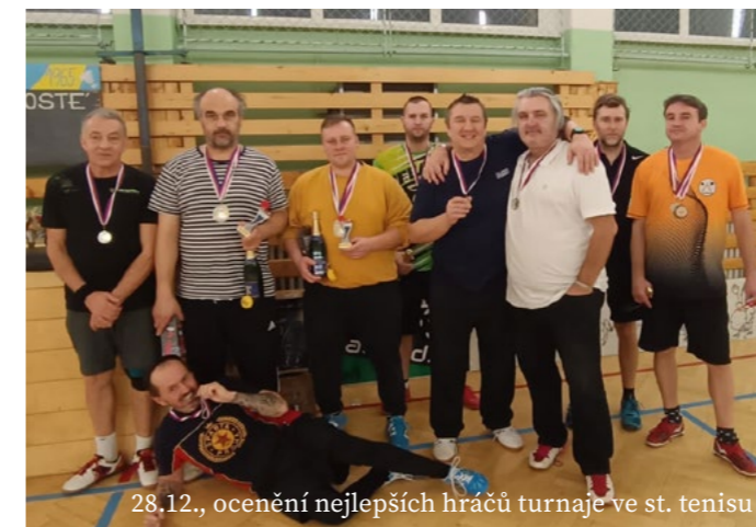
28.12., ocenění nejlepších hráčů turnaje ve st. tenisu