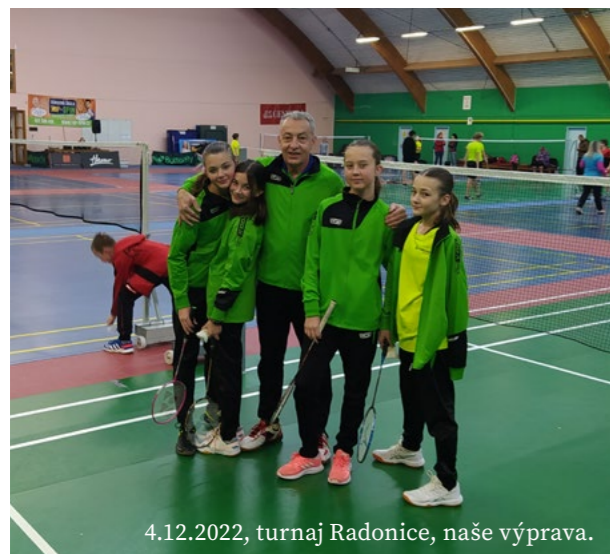
4.12.2022, turnaj Radonice, naše výprava.