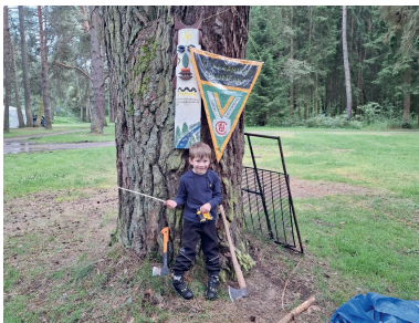
Cyklo- výlet Soustředění 2025