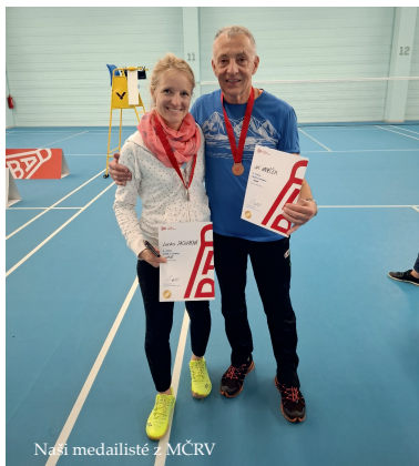
Naši medailisté z MČRV