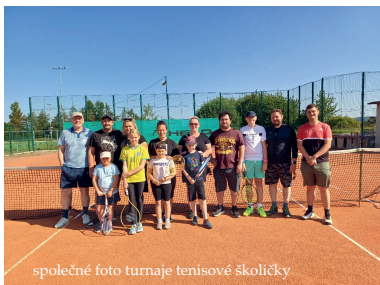
spočné foto turnaje tenisové školičky