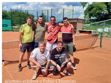
účastníci exhibice o Pohár Chlumčan