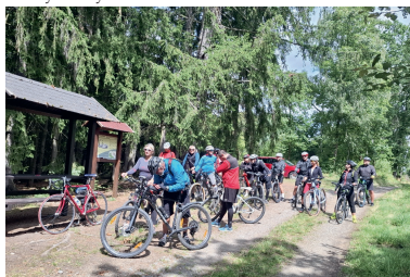
Průběžně navštívilo soustředění kolem 30 lidí.